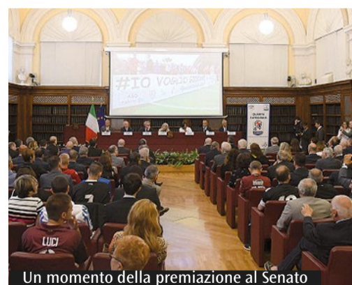
Un momento della premiazione al Senato

«Perché sei un essere speciale io avrò cura di te». Come cantava il maestro Battiato nella sua celeberrima "La Cura", così ha fatto il Csi con i suoi calciatori speciali di "Quarta Categoria", il torneo che ha visto protagonisti cittadini con abilità diverse, che hanno da poco concluso il campionato, disputato con 1300 tesserati in 17 regioni italiane. Lunedì scorso in un'affollatissima aula Koch del Senato sono state premiate le squadre "special" vincitrici dei rispettivi tornei regionali (Juventus, Benevento, Spal, Parma, Foggia, Salernitana, Alessandria, Sambenedettese e Livorno) e sono stati illustrati gli sviluppi del progetto "Quarta Categoria". Ma come accaduto anche negli stadi e negli impianti di gioco, dove si sono disputate le gare ed assegnati i titoli, poca importanza hanno rivestito i diversi colori delle bellissime maglie da gioco. A Palazzina Madama ve ne erano moltissime da quelle delle squadre di Serie A a quelle della Serie B, della Lega Pro e della Lnd, ovvero i 4 tonici "io" contenuti nell'hashtag #iovogliogiocarecalcio, da tutti il più apprezzato e applaudito gol del torneo. Più interessanti le persone, i ragazzi che le hanno su-